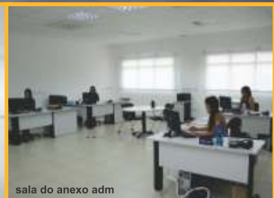
sala do anexo adm