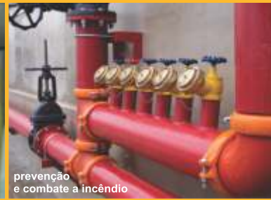
prevenção e combate a incêndio