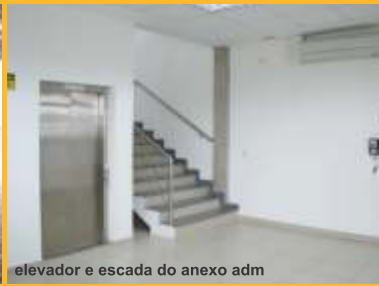
elevador e escada do anexo adm