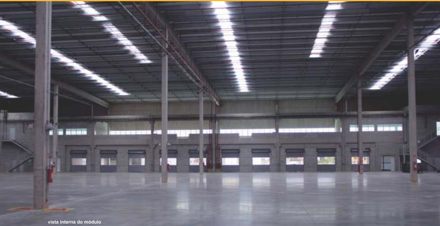
vista interna do módulo