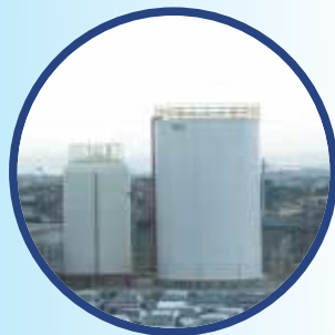
infraestrutura e autonomia