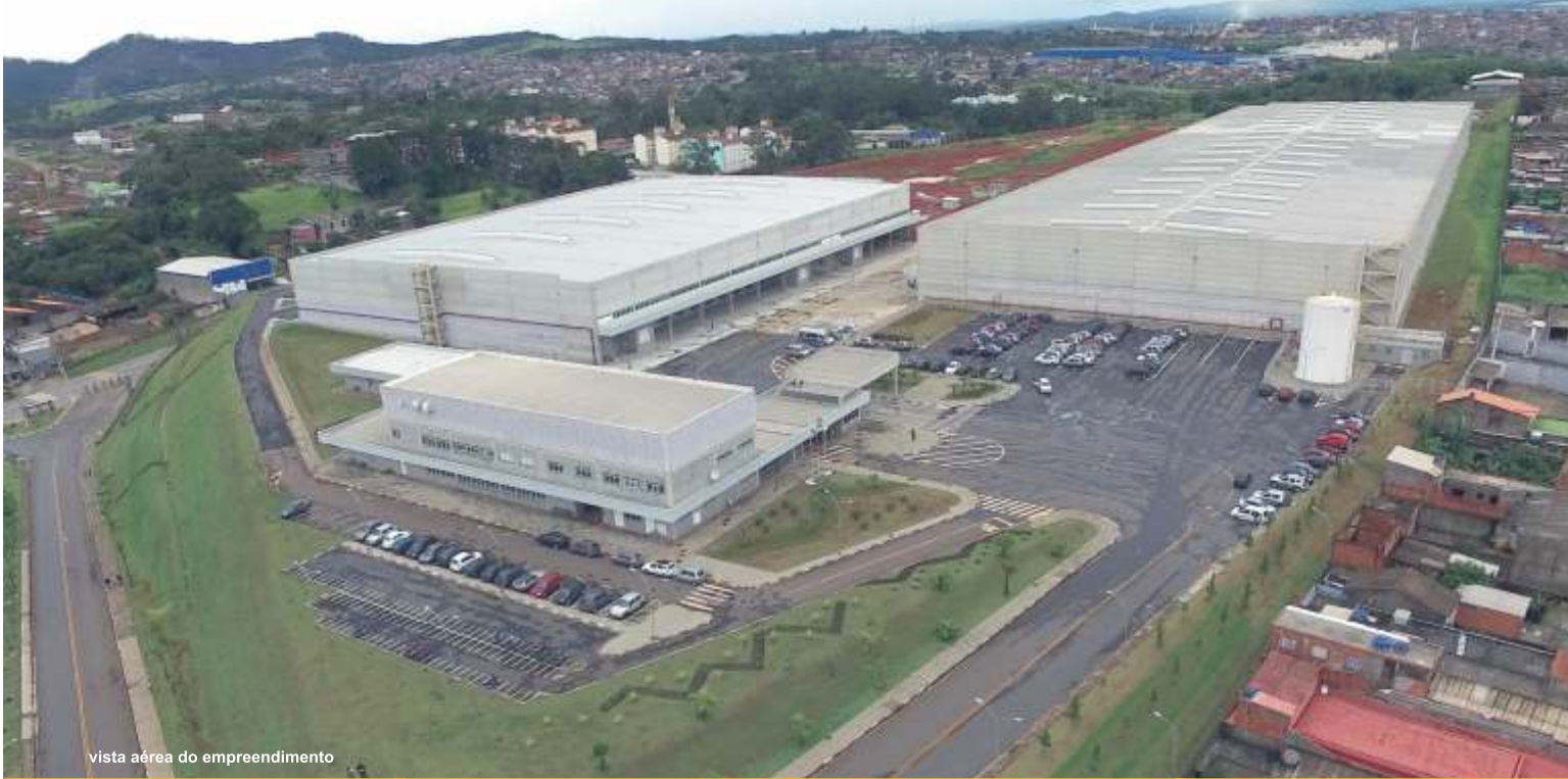
vista aérea do empreendimento